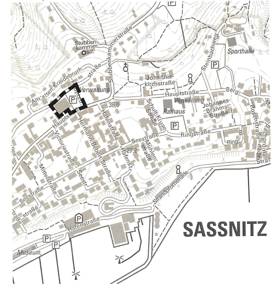
Auszug aus der topographischen Karte