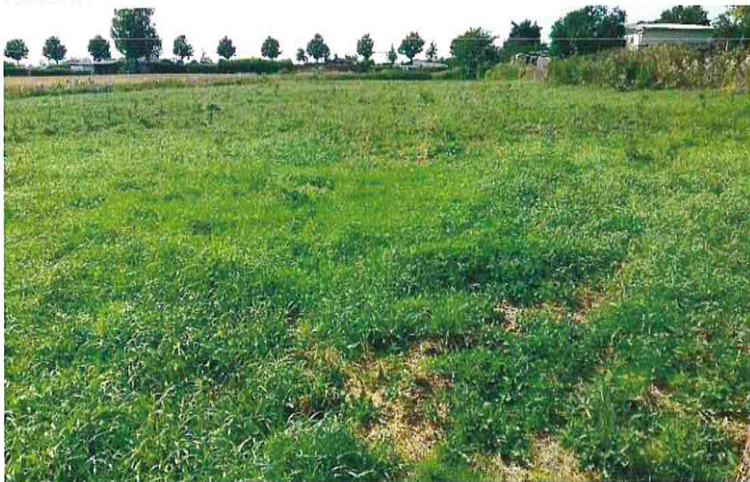
Blick auf das aufgelassene Frischgrünland im August 2019 (Foto: 08.08.19)

Das Grünland im Süden des Plangebietes hat einen frischen, anmoorigen und eutrophen Charakter. Dominierend sind Gemeine Quecke ( Elymus repens ) und Brennnessel ( Urtica dioica ). Weitere vorkommende Arten sind Kohlkratzdistel ( Cirsium oleraceum ), krauser Ampfer Sauerampfer ( Rumex crispus ), Sumpfschilf ( Stachys palustris ) sowie Haar-Segge ( Carex hirta ). Die Fläche wurde im Herbst gemäht und wird aktuell von Schafen mitbeweidet.