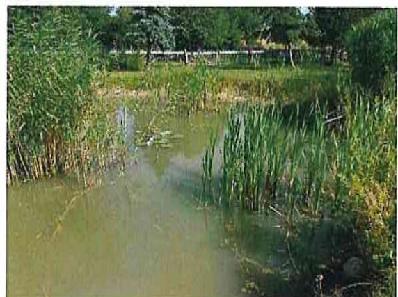
Regenrückhalteteich kurz nach der Ausbaggerung und Sommeraspekt (Fotos: 19.11.18 und 8.8.19)