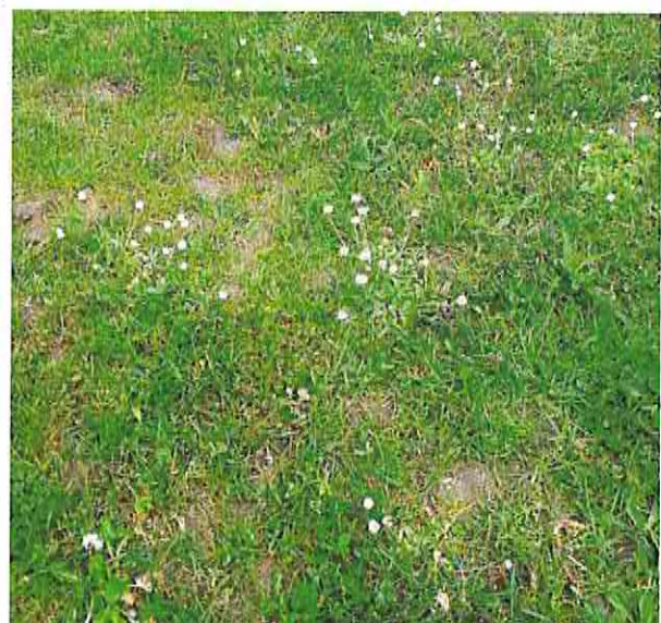
Detail-Aufnahmen des Intensivgrünlands im Mai 2020 (Foto 13.05.20)