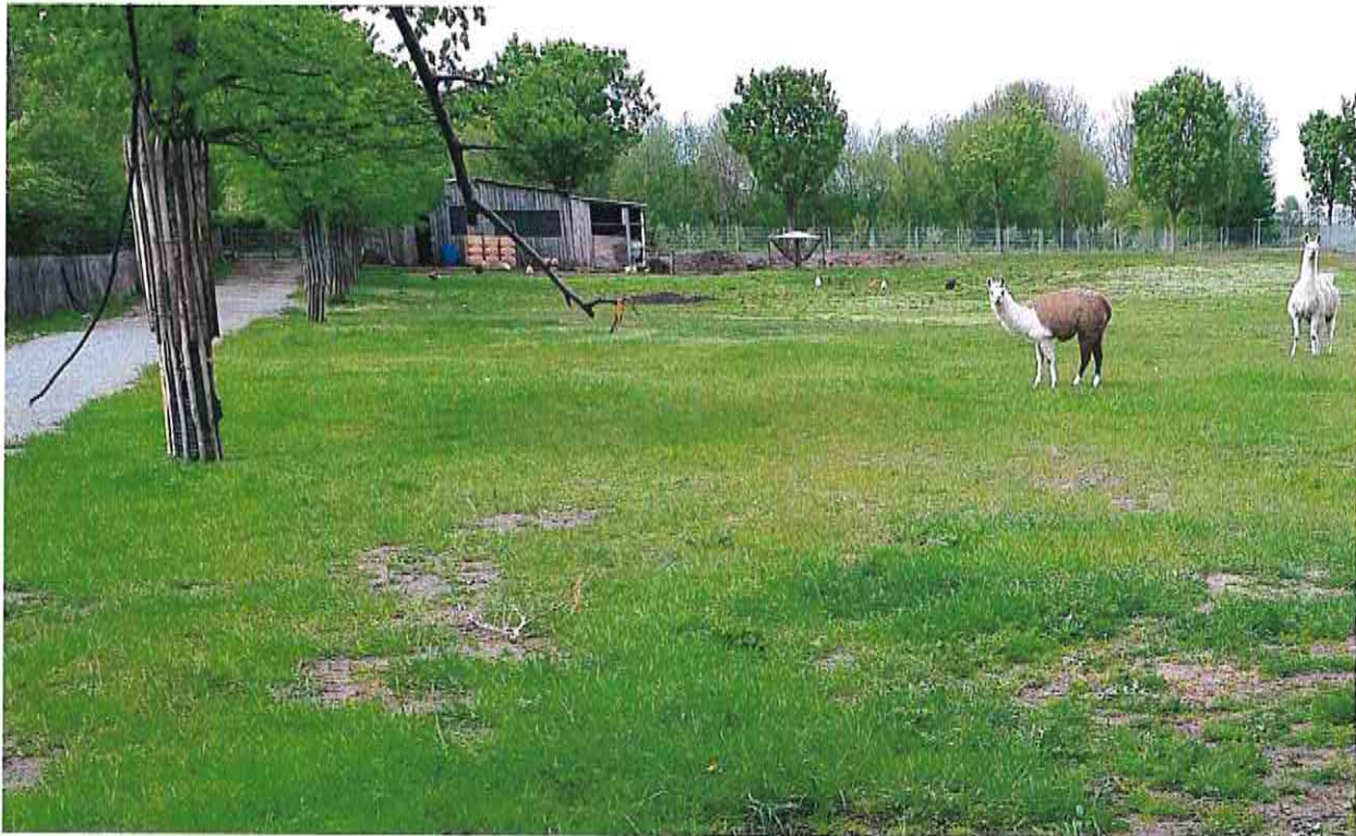
Blick auf das nördliche Intensivgrünland im Mai 2020 (Foto 13.05.20)

Die anderen Grünlandflächen sind deutlich trockener und kurzrasiger. Sie werden intensiv von Schafen, Alpakas und weiteren Haustieren beweidet. Die Beweidung erfolgt ganzjährig, so dass die Vegetation immer sehr kurz ist. Typische Arten sind Weidelgras ( Lolium perenne ), Wiesenripsengras ( Poa pratensis ), Weißklee ( Trifolium repens ), Löwenzahn ( Taraxacum sect. Ruderalia ), Spitzwegerich ( Plantago lanceolata ), Gänseblümchen ( Bellis perennis ). Daneben befinden sich einige Offenbodenstellen, die von Viehtritt stammen.